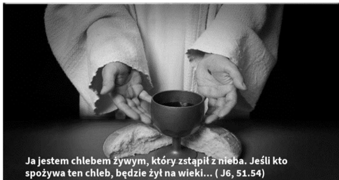
Ja jestem chlebem żywym, który zstąpił z nieba. Jeśli kto spożywa ten chleb, będzie żył na wieki... (J 6, 51.54)

Jezus powiedział do Żydów: „Ja jestem chlebem żywym, który zstąpił z nieba. Jeśli ktoś spożywa ten chleb, będzie żył na wieki. Chlebem, który Ja dam, jest moje Ciało, wydane za życie świata”. Sprzeczali się więc między sobą Żydzi, mówiąc: „Jak On może nam dać swoje ciało do jedzenia?”. Rzekł do nich Jezus: „Zaprawdę, zaprawdę, powiadam wam: Jeżeli nie będziecie jedli Ciała Syna Człowieczego ani pili Krwi Jego, nie będziecie mieli życia w sobie. Kto spożywa moje Ciało i pije moją Krew, ma życie wieczne, a Ja go wskreszę w dniu ostatecznym. Ciało moje jest prawdziwym pokarmem, a Krew moja jest prawdziwym napojem. Kto spożywa moje Ciało i Krew moją pije, trwa we Mnie, a Ja w nim. Jak Mnie posłał żyjący Ojciec, a Ja żyję przez Ojca, tak i ten, kto Mnie spożywa, będzie żył przeze Mnie. To jest chleb, który z nieba zstąpił – nie jest on taki jak ten, który jedli wasi przodkowie, a pomierali. Kto spożywa ten chleb, będzie żył na wieki”.